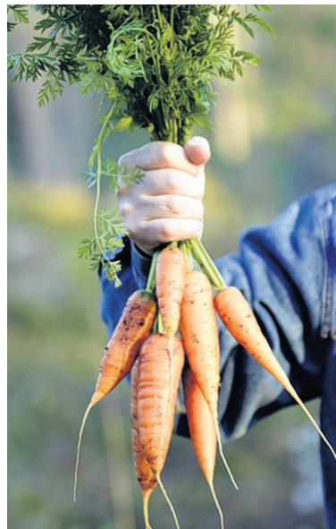
Alle stadsproducten eerst goed wassen, maar dat geldt ook voor producten uit de gangbare landbouw.

Belangrijker nog is de vraag of het probleem wel zo groot is als gesuggereerd wordt. Fijnstof is in eerste instantie vooral schadelijk bij inademen. Dat blijft dus, of je nou een tuin hebt of niet. Fijnstof dat via planten ingenomen wordt, gaat via de maag en darmen en niet via de longen,