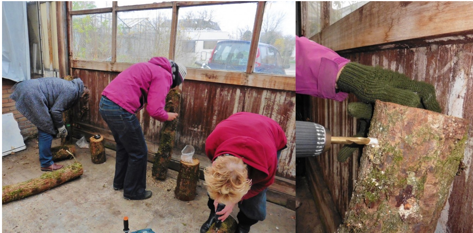
Shiitake broed in eikenhoutenstammetjes aanbrengen